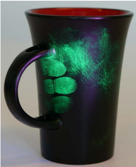
指纹在黑色杯子上