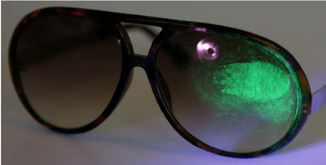
指纹在褐色太阳镜上