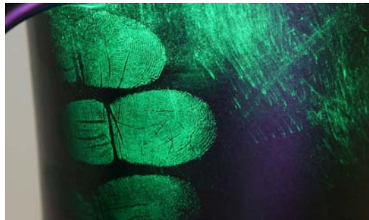
指纹在有图案的杯子上